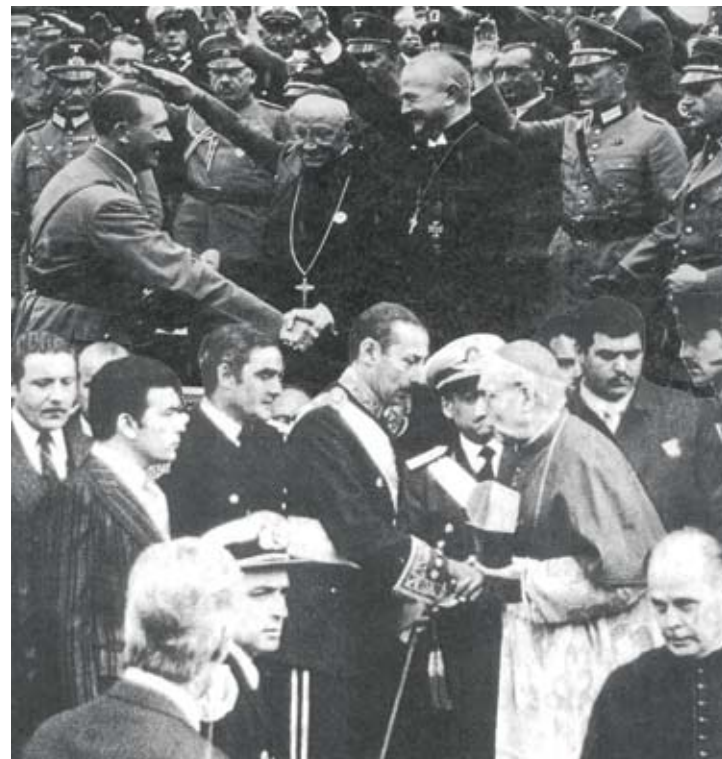
30 Hitler saluda al abad católico Schachtleitner y al primado evangélico Muller. + Jorge Videla saluda al cardenal Aramburu.

19. ¿Qué motiva la búsqueda indefinida de poder? ¿El capitalismo? ¿La pulsión de muerte? Desde la psicología se ha criticado a la civilización dominante por