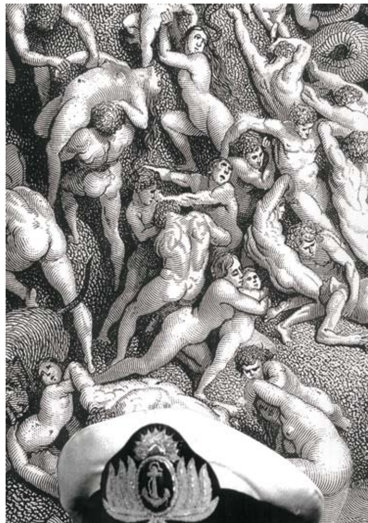
43 Diluvio, Doré + gorra de oficial de la Armada

De la Serie Nunca Más 43. León Ferrari. Collage para los fascículos de Nunca Más editados por Página 12 ; 29,7x42 cm. (1995). FALFAA