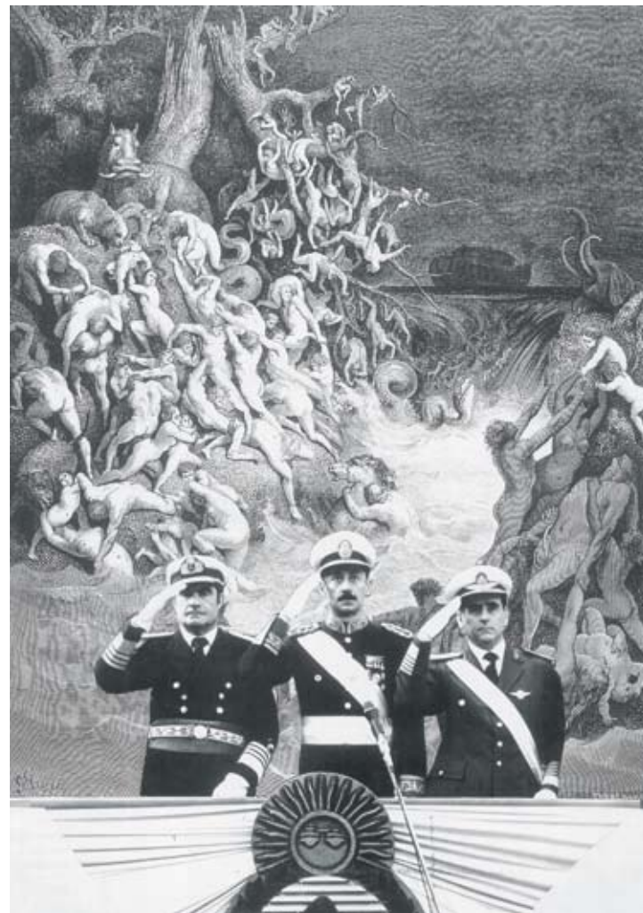
1 Diluvio de Doré, 1860 + Junta militar (foto: Secretaría de Información Pública)

De la Serie Nunca Más 1 . León Ferrari. Collage para los fascículos de Nunca Más editados por Página 12 ; 29,7x42 cm. (1995). FALFAA