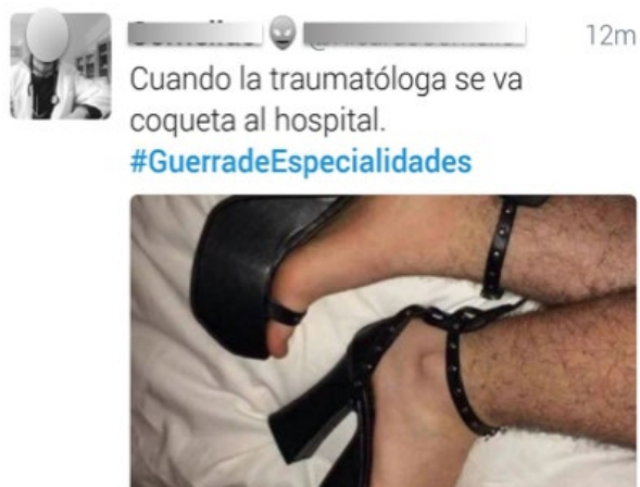
Imagen 4. Ejemplo de chiste sexista en redes sociales